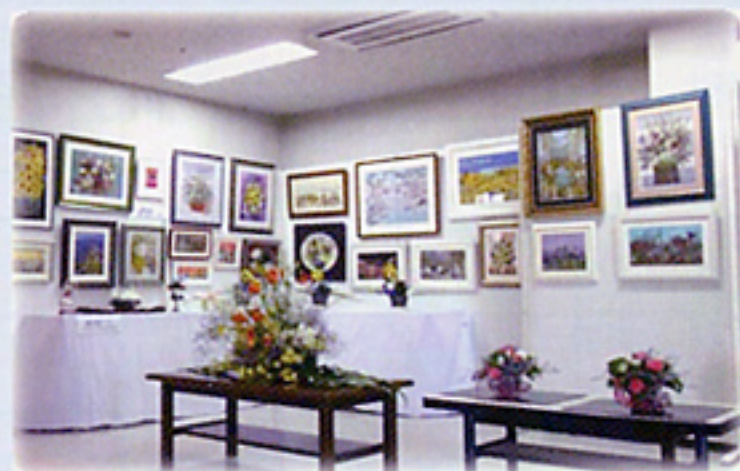
二瀬公民館サークルの方の展示物です。とても素晴らしい作品ばかりで入所者の方が感激していました。