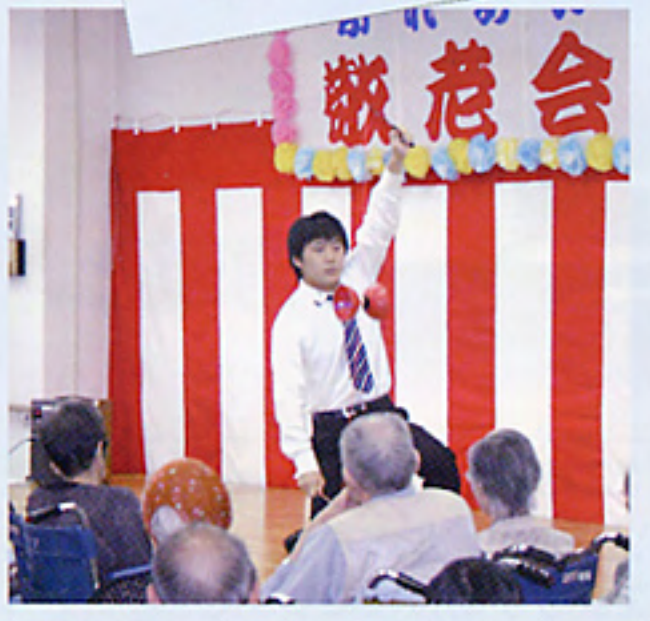
九工大ビルエットの皆さんによるジャグリング