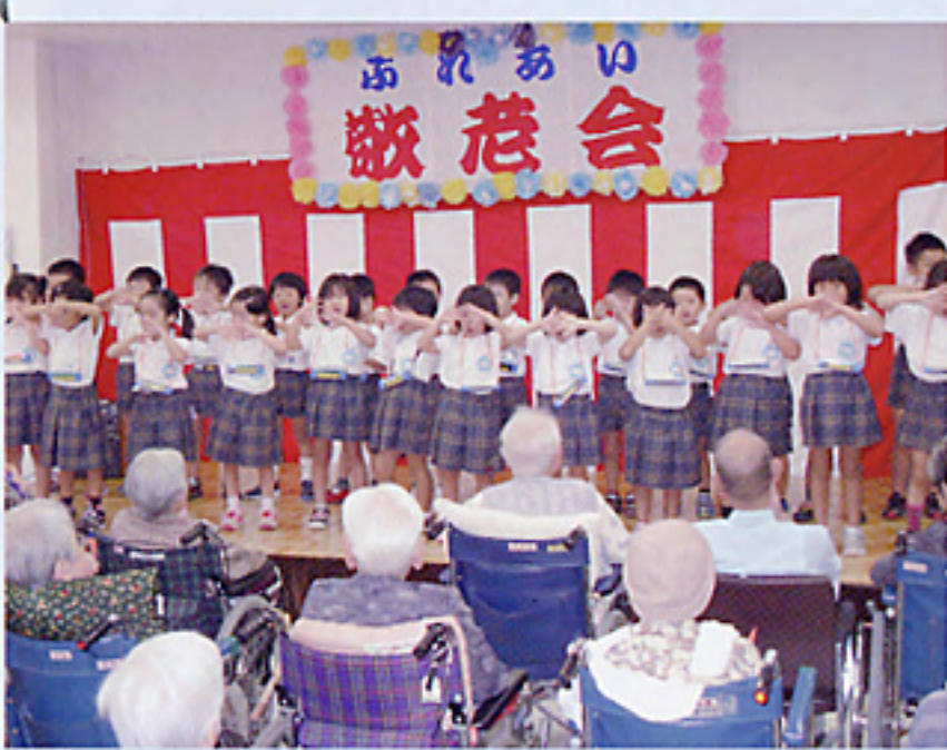
伊岐須幼稚園の皆さんによる歌や踊り

9月17日(金)二瀬病院介護老人保健施設で敬老会が開催されました。100歳以上の4名の入所者を始め、他入通所者の方々へのお祝いや、地域の様方によるアトラクションがあり、楽しい時間を過ごすことが出来ました。