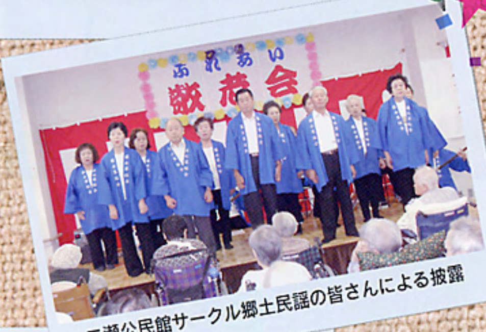
二瀬公民館サークル郷土民謡の皆さんによる披露