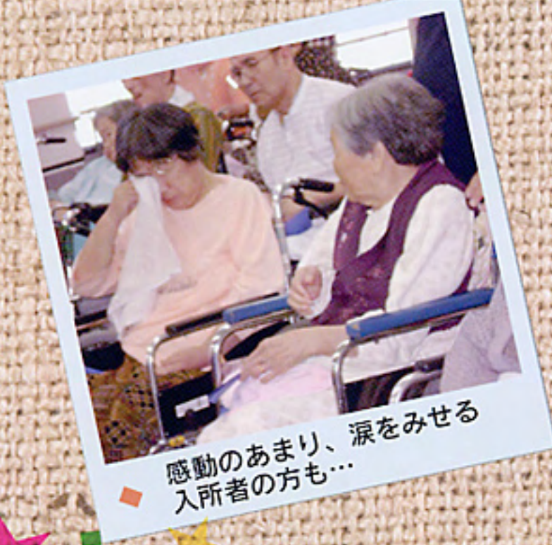
感動のあまり、涙をみせる入所者の方も...