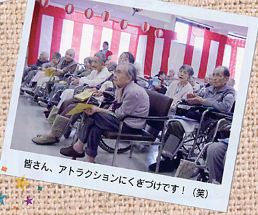
皆さん、アトラクションにくぎづけです!(笑)