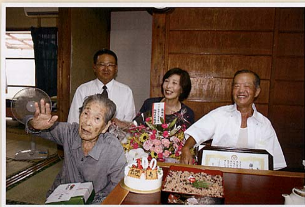
家族みんなて記念撮影