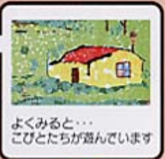
デイケアの通所されている方々でつくった作品