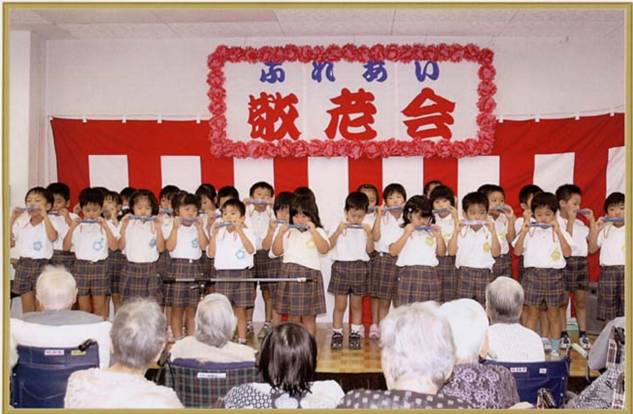
伊岐須幼稚園園児さんによる演奏

●企画・発行 社会保険 二瀬病院 広報委員会 〒820-0054 福岡県飯塚市伊川1243番地1 TEL 0948-22-1526 FAX 0948-29-0903