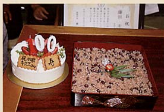
娘さんの手作りのお赤飯と 100歳のろうそくで飾られたケーキ