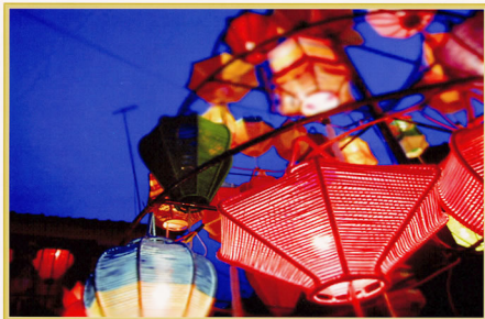
長崎ランタン祭り

●企画・発行 社会保険 二瀬病院 広報委員会 〒820-0054 福岡県飯塚市伊川1243番地1 TEL 0948-22-1526 FAX 0948-29-0903