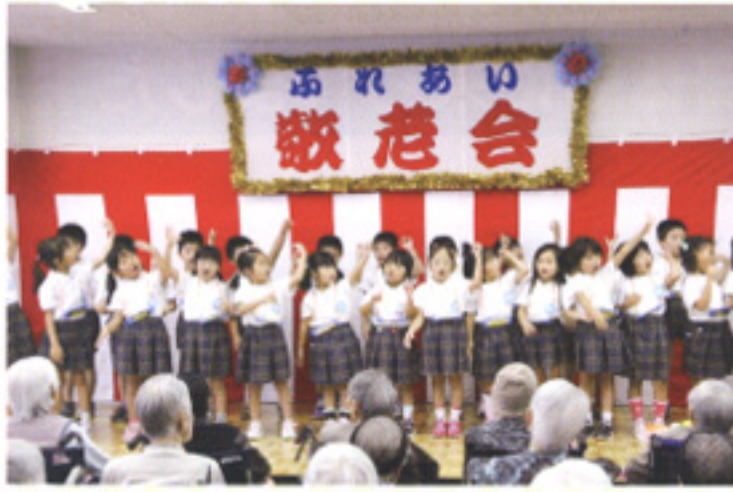
伊岐須幼稚園の皆さん