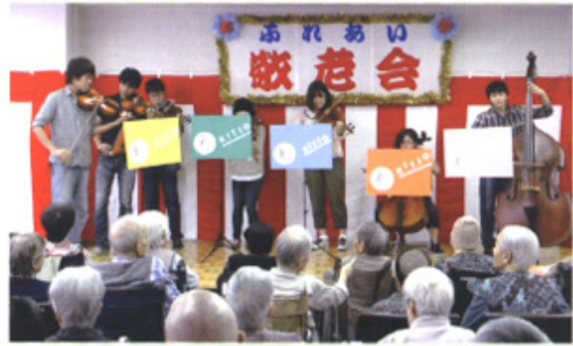
九州工業大学交響楽団の皆さん