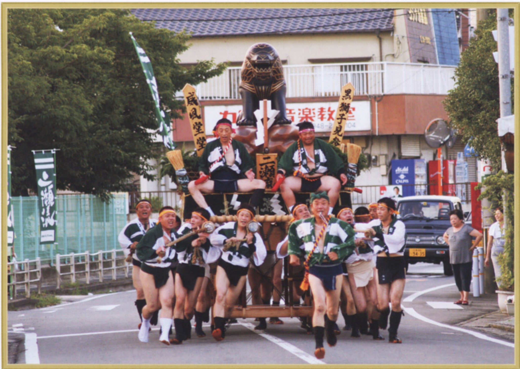
飯塚山笠 二瀬流れ

●企画・発行 社会保険 二瀬病院 広報委員会 〒820-0054 福岡県飯塚市伊川1243番地1 TEL 0948-22-1526 FAX 0948-29-0903