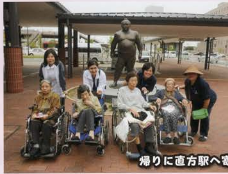
帰りに直方駅へ寄り道しました。