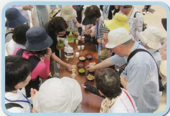
島屋製菓での試食