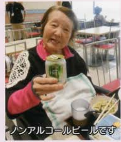
ノンアルコールビールです