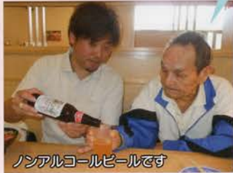
ノンアルコールビールです