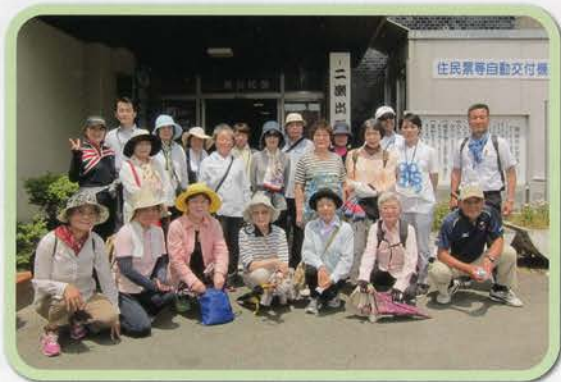
二瀬公民館前にて