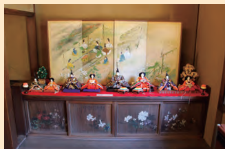
麻生大浦荘の雛飾り