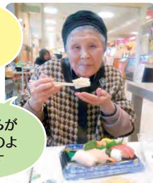
お寿司と天ぷらが 食べたかったのよ いただきます