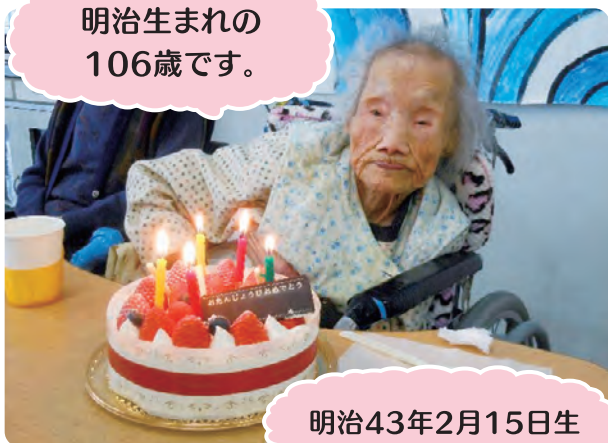
明治生まれの 106歳です。

当施設には、今年の2月15日で106歳を迎えられた方がいらっしゃいます。 まだまだお元気でお祝いのケーキをたくさん食べられました。 また今年100歳になられた方で、ご家族より百寿のお祝いとして100本の薔薇を贈呈された方も いらっしゃいました。おめでとうございます。