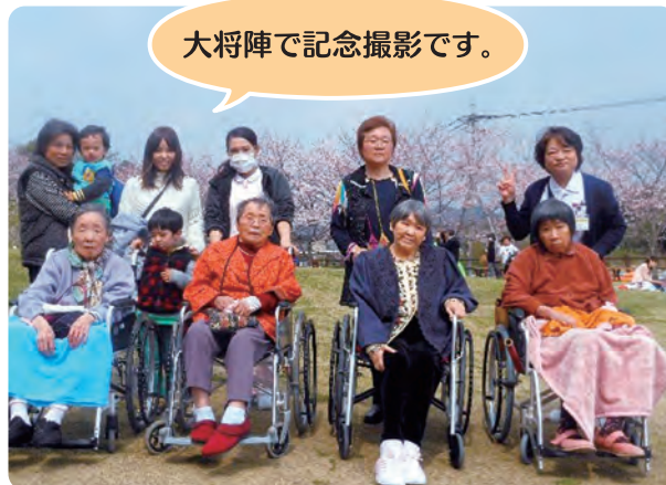
大将陣で記念撮影です。