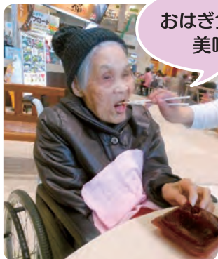
おはぎ食べています 美味しい〜!

1月・2月・3月とあっという間に過ぎ、春がやってきました。ポカポカ陽気になるとなんだか気持ちもワクワクします。暖かくなったことで、入所者の皆さんと外出をしました。 3月23日(水)お買い物と昼食を食べに穂波イオンへ、3月30日は大将陣公園へお花見に行きました。 ご家族にも一緒に参加していただき、楽しいひとときを過ごしていただきました。