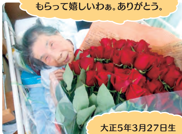
100歳のお祝いで、こんなに もらって嬉しいわあ。ありがとう。