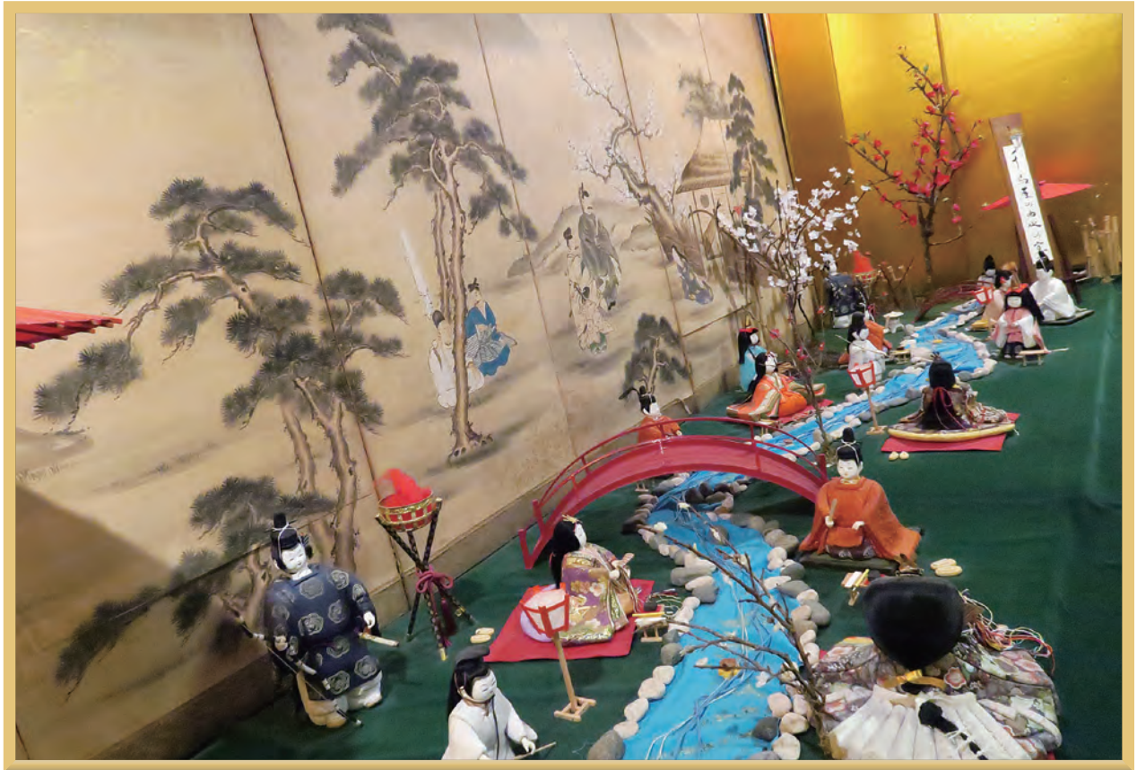
いいつか 雛(ひいな)のまつり (曲水の宴:千鳥屋本家)

●企画・発行 社会保険 二瀬病院 広報委員会 〒820-0054 福岡県飯塚市伊川 1243 番地 1 TEL 0948-22-1526 FAX 0948-29-0903