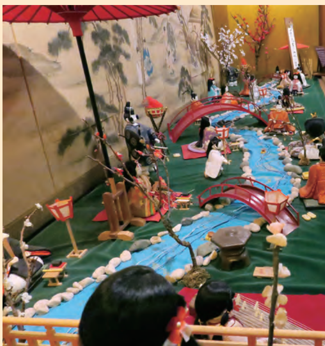
曲水の宴：千鳥屋本家

九州に春の訪れを告げる祭り「ひなの国九州」とは、ひな祭りの伝統を重んじてきた九州各地の12の市で、毎年開催されるお祭りです。九州各地に伝わる古式ゆかしい雛人形やその土地ならではの個性的なひな飾りは、訪れた人々にいしえの文化との出会いと新しい感動を与えてくれます。雛人形は、江戸時代に入ると雛は立雛から坐雛へと成熟度をまし、九州にはその人形達が数多く残っています。九州には地理的条件の中、徳川家や大名家の姫が嫁入りされたとき、持参して来た人形が数多く愛しまれ、その大名家や商家が取りつぶされる事なく、戦火にもあわず多くの種類の人形達が残って現在に至っています。また、九州各地の庶民の生活の中から生まれた個性豊かな雛人形も多数生まれ、まさに九州は雛人形の宝庫と言えます。