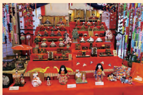
飯塚信用金庫の雛飾り