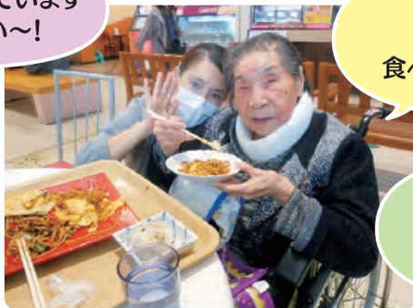
オムそばよ! こんなに 食べきれなかった