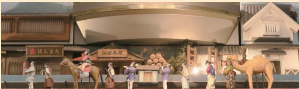
大名行列の様子(背景には当時の飯塚街道の街並みが再現されています)