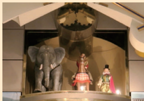
象・馬に乗った武士・西洋人