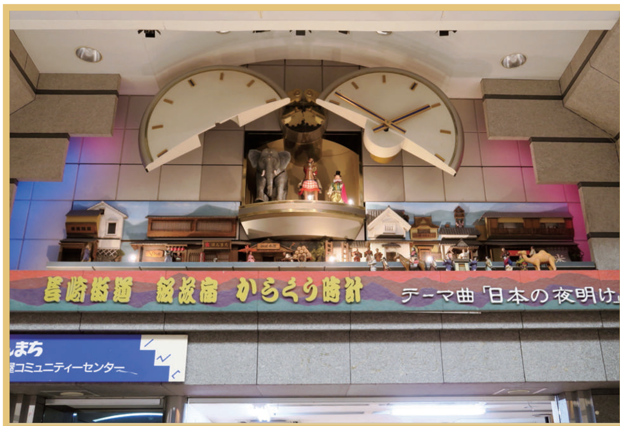
飯塚本町商店街のからくり時計